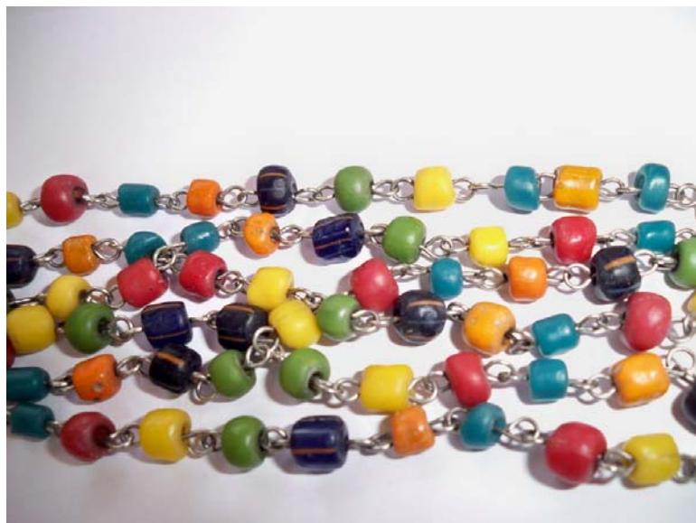
สร้อยคอลูกปัด ลักษณะเป็นหินสีต่างๆ ที่มีความสวยงาม สมัยทวารวดี