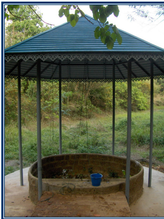
บ่อน้ำทิพย์ ได้รับการบูรณะในปี พ.ศ. ๒๕๔๙

บ่อน้ำทิพย์มีลักษณะเป็นบ่อวงกลมสร้างด้วยอิฐ ตั้งอยู่ในพื้นที่โบราณสถานเมืองดงละคร ชาวบ้านมีความเชื่อว่าเป็นบ่อน้ำศักดิ์สิทธิ์ มีความเชื่อว่าเมื่อมีโรคภัยก็นำน้ำจากบ่อมาดื่มกินจะทำให้หายจากอาการป่วย