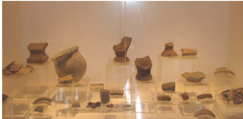
เศษภาชนะเครื่องปั้นดินเผาที่ขุดพบในโบราณสถานเมืองดงละคร

นิทรรศการโบราณวัตถุ ตั้งอยู่ใกล้กับโบราณสถาน หมายเลข 1 จัดแสดงนิทรรศการข้อมูลเกี่ยวกับเมืองโบราณดงละคร และโบราณวัตถุที่ขุดได้ในบริเวณนี้ เช่น เศียรพระพุทธรูปกาไหล่ ทองสมัยทวารวดี แผ่นทอง เมล็ดข้าวสารดำ เตาทลอมโลหะขนาดเล็ก ชิ้นส่วนเครื่องปั้นดินเผาสมัยทวารวดี เศษกระเบื้องของจีน สมัยราชวงศ์ถัง คันฉ่องสำริด อายุราวพุทธศตวรรษที่ ๑๘ เป็นต้น