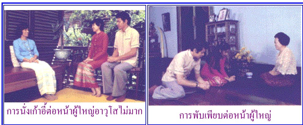
การนั่งเก้าอี้ต่อหน้าผู้ใหญ่อาวุโสไม่มาก

6. การนั่งเล่นหรือนั่งพักผ่อน คือ การนั่งในกิริยาบถตามสบาย จะนั่งในลักษณะใดก็ได้ตามความพอใจ เช่น นั่งกับพื้น แต่เมื่อผู้ใหญ่ผ่านเข้ามาในที่นั้นควรนั่งสำรวจ ไม่ไขว่ห้าง ไม่กระดิกเท้าหรือเหยียดเท้าไปทางผู้ใหญ่