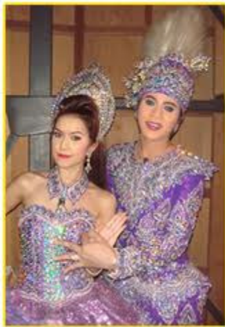
การแต่งกายของลิเก ชาย -หญิง ในปัจจุบัน